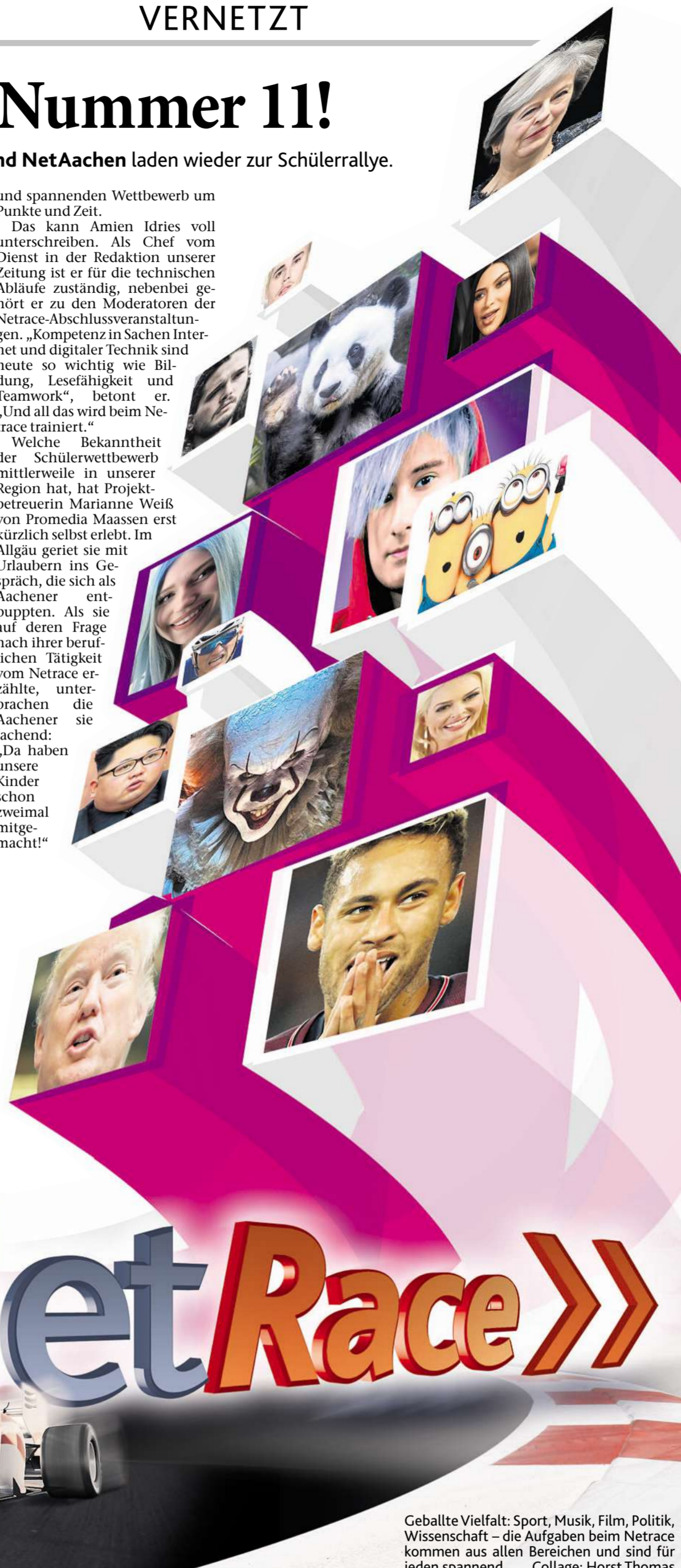
Geballte Vielfalt: Sport, Musik, Film, Politik, Wissenschaft – die Aufgaben beim Netrace kommen aus allen Bereichen und sind für jeden spannend. Collage: Horst Thomas

Ihm ist es ein Anliegen, „den Schülern Rüstzeug an die Hand zu geben, kritisch und kompetent den Wahrheitsgehalt von Inhalten im World Wide Web zu hinterfragen und zu prüfen“. Und am leichtesten gelinge das im fordernden